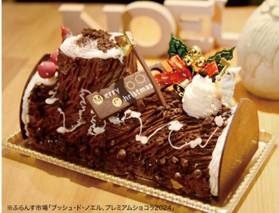
※ふらんす市場「ブッシュ・ド・ノエル、プレミアムショコラ2024」

シュトーレン、ケーキ、チキン...この時期だけの華やかなメニューがたくさん。全部食べたいクリスマス。今年は気になるあの店で。