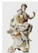
マイセン(フィギュア)

会期:12/7(土)~15(日) 開票:12/18(水) 美術品、工芸品、アンティーク家具、骨董品等、約1000点展示。どなたでも参加できます。