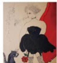
フジコヘミング(版画)