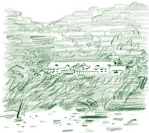
あと10年このままなら 世界遺産?