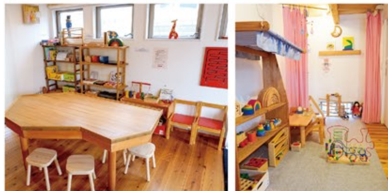
上/2階にある「TOYS&GIFTS MOMO」の店内。商品は対象年齢ごとにわけて飾られている 左下/1階の「つみきのおうち」。おもちゃのほか、約200種類あるボードゲームで遊ぶこともできる 右下/「つみきのおうち」には小さな赤ちゃんが過ごしやすいようカーペットが敷かれたスペースも