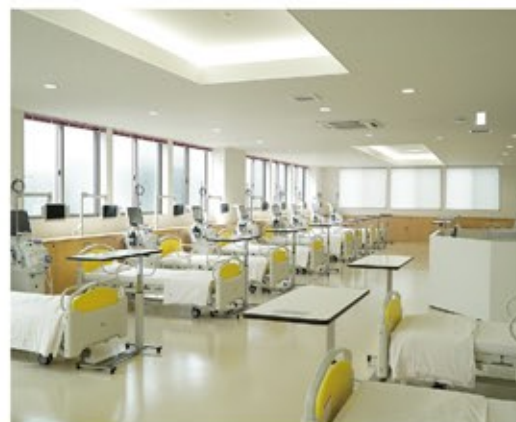
左上 / 2023年8月1日にオープンする藤岡の医療介護施設はこれまでの結晶とも言える 右上 / 手術室の他、体の中をリアルタイムで見られる透視室といった高度医療機器を備えている 左 / 新しい透析施設では日当たりの良い広々とした透析室を備えている。医師と看護師の他に、臨床工学士が携わり体制は万全。全国から多くの問い合わせが寄せられている