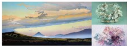
「霧ヶ峰から富士山を望む」 三村 治男